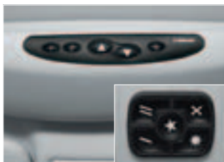
Pannello Soft Touch

Webasto offre una varietà di comandi e accessori con funzioni intelligenti, tecnologia perfetta e di facile gestione per ciascun tetto apribile. Seleziona il comfort che preferisci: